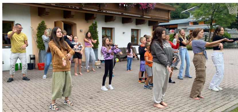
Alle voll motiviert bei den Gruppentänzen

Impressum: Zu Risiken und Nebenwirkungen oder bei weiteren Fragen, lesen Sie die Packungsbeilage und fragen Sie Ihren Arzt oder Apotheker. Lob aber bitte gerne an uns :)