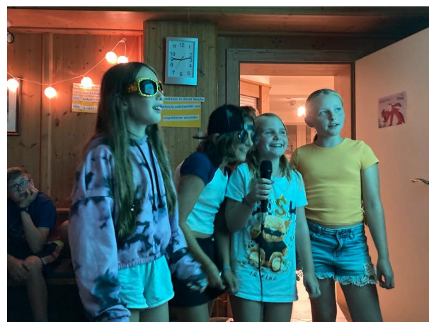
Ganz viel Input vom Karaokeabend