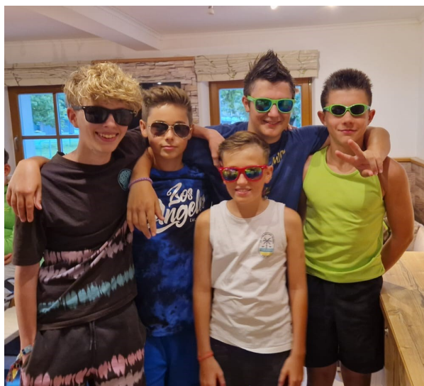
Beim heutigen Karaokeabend hat uns die Boyband mit dem klingendem Namen „Zimmer 5“ mit zwei Songs beehrt.