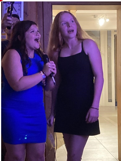
Die Lieder wurden „gefühl“