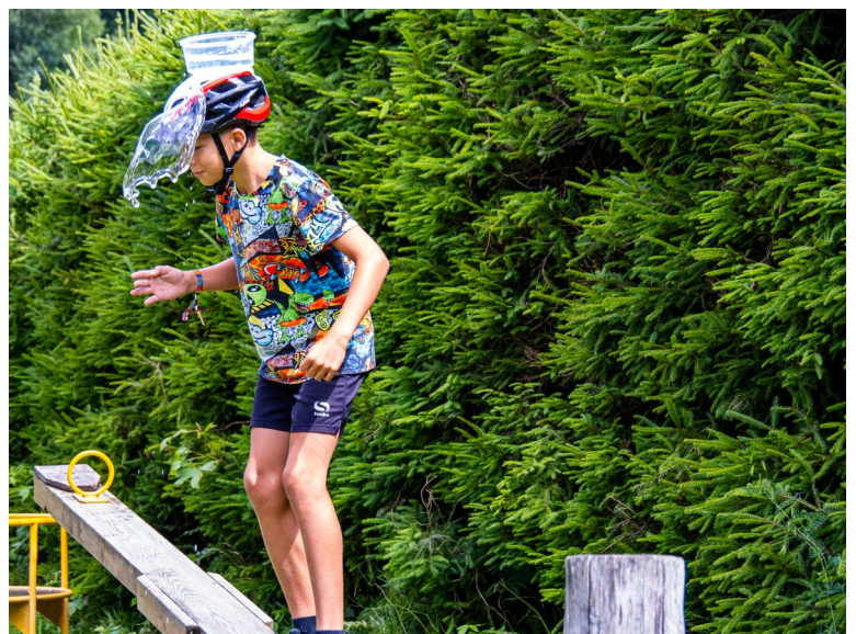
Im Kampf gegen die Hunnen blieben die Teilnehmer trotz Regenpause nicht trocken

Impressum: Wir bedanken uns bei den Sponsoren Bezirksblatt, Kronenzeitung und Heute für das Bereitstellen ihrer hochwertigen Zeitungen für den heutigen Catwalk.