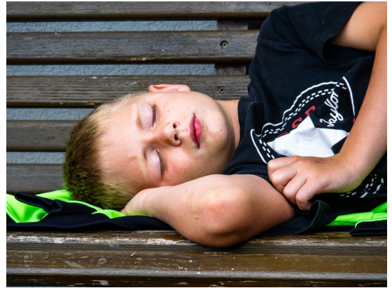
Nicht nur die Lagercrew ist mittlerweile auf kleine Nickerchen untertags angewiesen...