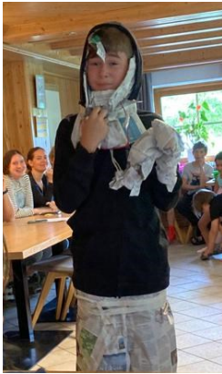
Nach der Modenschau gaben sich die Teilnehmer zu erkennen